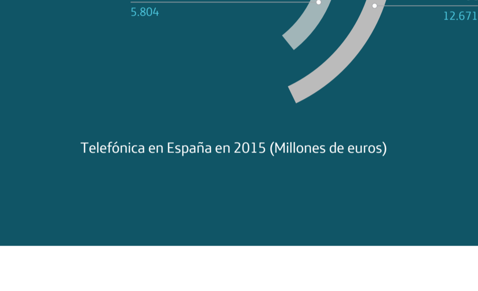
Telefonica en España en 2015 (Millones de euros)

Los resultados obtenidos en 2015 constituyen un excelente punto de partida sobre el que seguir avanzando en nuestra transformación, garantizar el acceso a la vida digital y mejorar la vida de las personas así como la digitalización de las empresas y las instituciones a través de la innovación