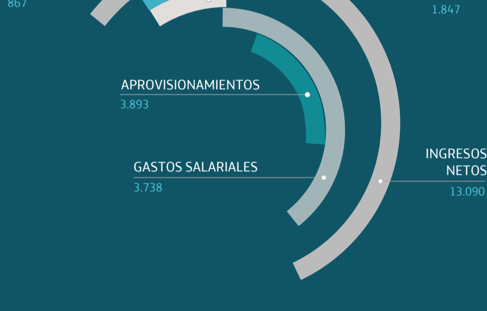
Telefónica en España en 2016 (Millones de euros)

Los resultados obtenidos en 2016 constituyen un excelente punto de partida sobre el que seguir avanzando en nuestra transformación, garantizar el acceso a la vida digital y mejorar la vida de las personas así como la digitalización de las empresas y las instituciones a través de la innovación